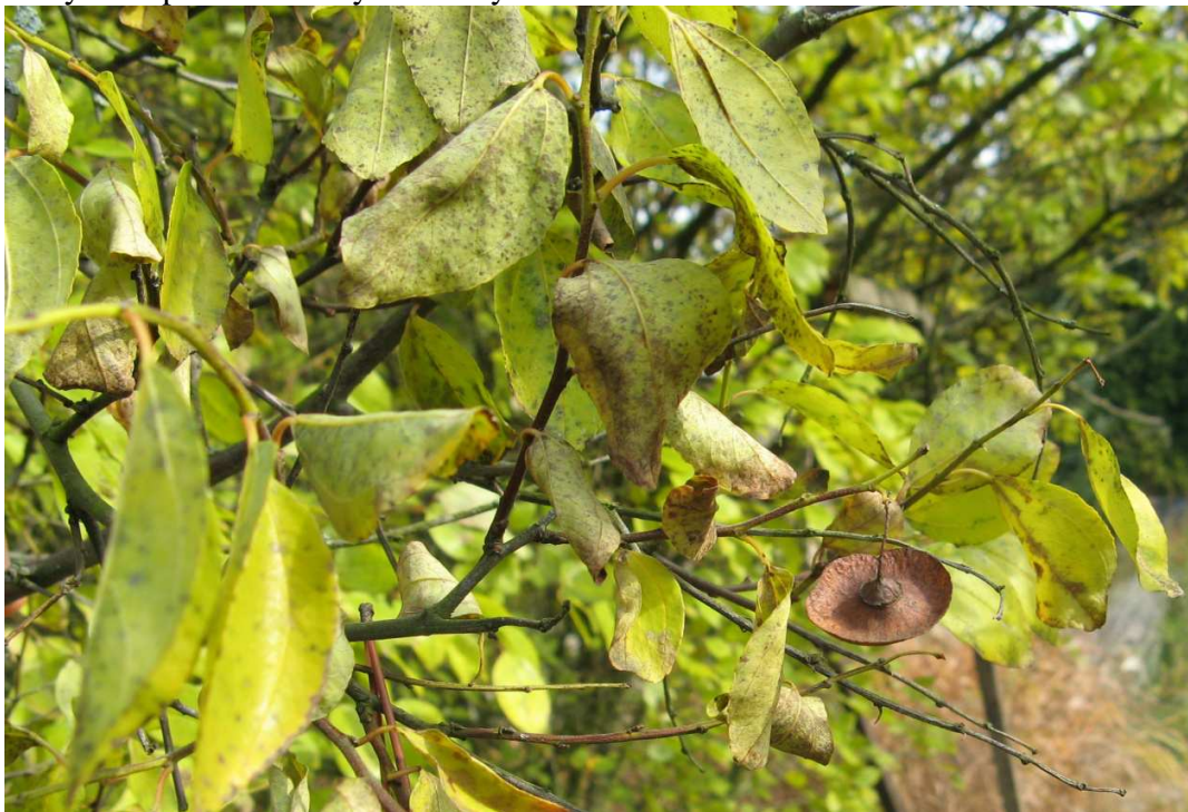
oříšek s lemem

Plody – 2-3pouzdré oříšky s křídlatým lemem